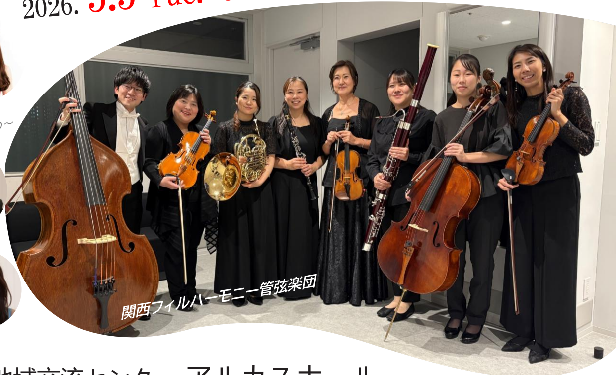
関西フィルハーモニー管弦楽団