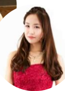
加・鳥・松・月 ~モーツァルト劇場inねやがわ~